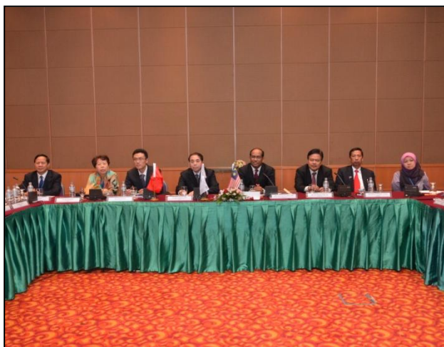
Pegawai Kanan Sedang Mendengar Taklimat