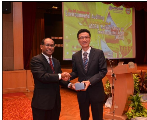
YBhg. Dato' Timbalan Ketua Audit Negara (Negeri) memberi cenderahati kepada Pemudahcara dari China