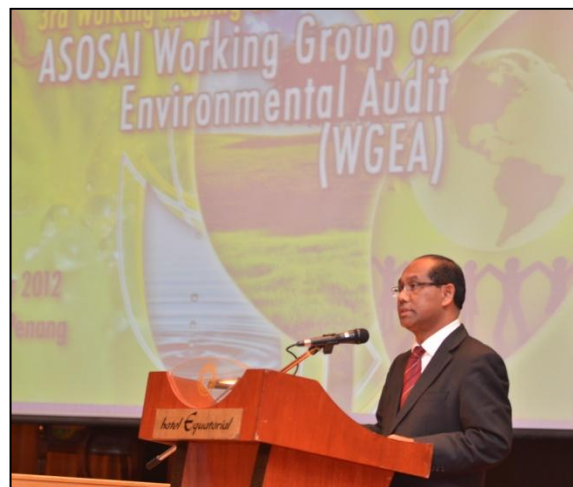
Ucapan Penutup oleh YBhg. Dato' Timbalan Ketua Audit Negara (Negeri)