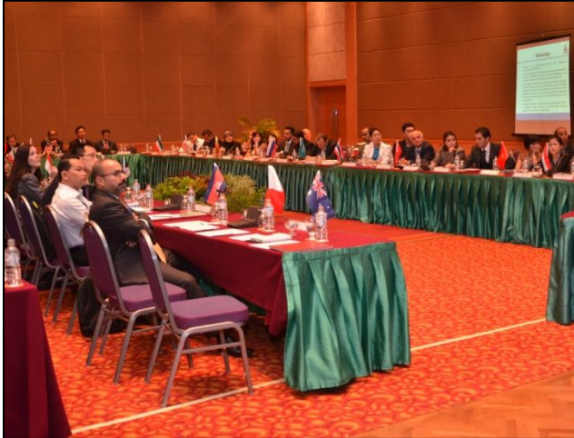
Peserta Sedang Mendengar Pembentang Kertas Kerja