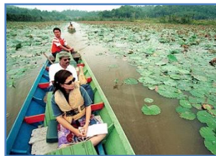
PELANCONG tempatan menyusuri Tasik Chini yang dipenuhi pokok bunga teratai.

Irwan Shafrizan Ismail irwansha@bharian.com.my