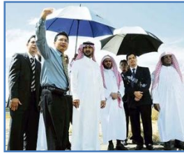
DR BANDAR SALMAN (tiga dari kiri) mendengar penjelasan Rashid ketika melawat tapak kampus MEDIU di Cyberjaya, semalam.

CYBERJAYA: Kampus tetap sebuah lagi universiti Islam di negara ini, Universiti Antarabangsa al-Madinah (MEDIU), di sini dijangka siap dalam tempoh empat tahun dengan pengambilan pertama seramai 5,000 pelajar. Kampus itu yang dibina di atas tapak seluas 400 hektar bakal menjadi hab pendidikan dunia yang akan menyaksikan kemasukan lebih ramai pelajar antarabangsa ke negara ini.